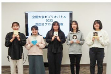
パトラー全員による記念撮影