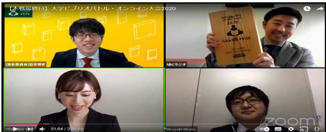
(Zoomでの授賞式の様子)

https://bibliobattle-award2020.mystrikingly.com/